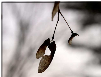
フロペラ (かえでの種)