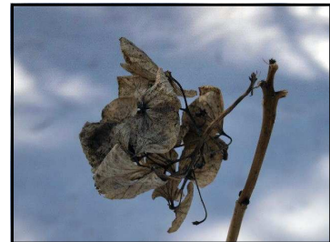
かれたあじさいの花