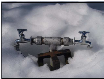
雪に埋もれた水道管