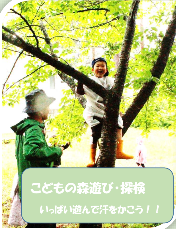
こどもの森遊び・探検